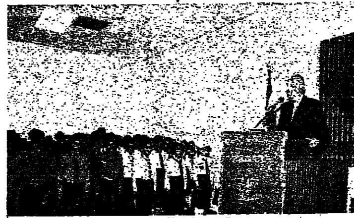
السيد سلام يقف كلمته